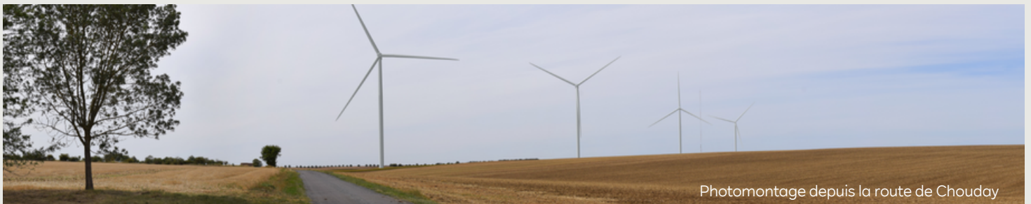
Photomontage depuis la route de Chouday

Toute l'actualité du projet à retrouver sur : raisinieres.projet-eolien.com